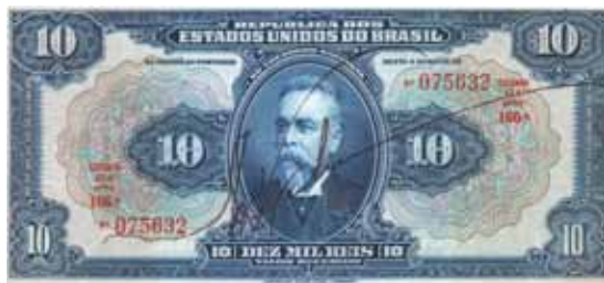
Cédula de 10 mil Réis, emitida em 1942, retratando Campos Salles.