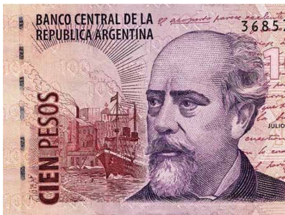
Figura 1 – Detalhe da cédula de 100 pesos da Argentina (2011) que vem sendo produzida pela Casa da Moeda do Brasil em virtude do acordo denominado “União Transitória de Empresas – UTE”, existente entre a Casa da Moeda do Brasil e a Casa da Moeda da Argentina.