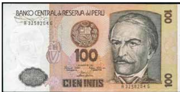
Figura 4 – Anverso da cédula de 100 intis, do Peru (P.132a), emitida em 1985 e impressa pela Casa da Moeda do Brasil (CdM-B). À direita, temos Ramon Castilla.