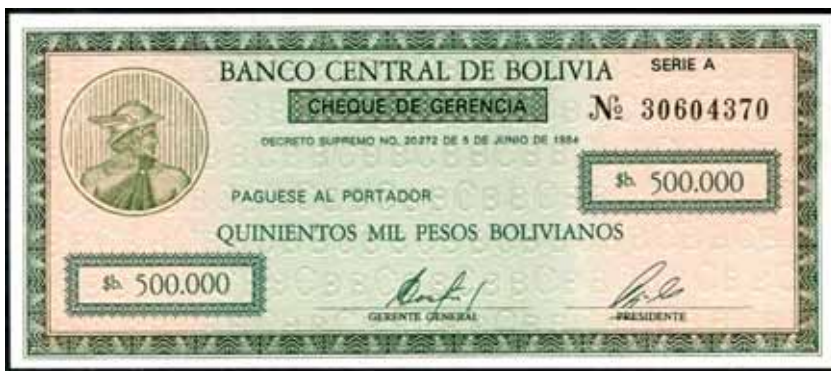
Figura 2 – Anverso da cédula de $b 500.000 pesos bolivianos (P.189), da Bolívia, emitida em 1985 e impressa pela Casa da Moeda do Brasil (CdM-B). À esquerda, no medalhão, temos Mercúrio, figura mitológica do Comércio.