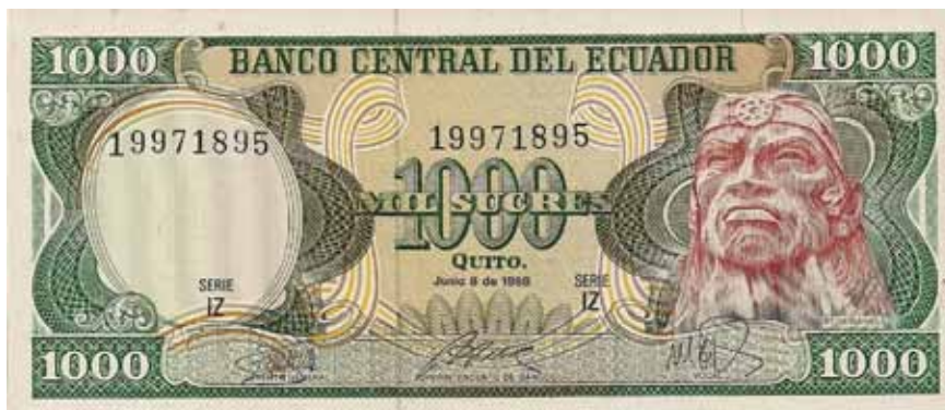
Figura 6 – Anverso da cédula de 1000 sucres, do Equador (P.125b), emitida em 1988 e impressa pela Casa da Moeda do Brasil (CdM-B). À esquerda, temos Riminahut. Esta cédula não contém a marca do impressor.