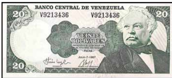
Figura 3 – Anverso da cédula de B$ 20 bolivares (P.64), da Venezuela, emitida em 1985 e impressa pela Casa da Moeda do Brasil (CdM-B). À direita, temos Jose Antonio Paez.