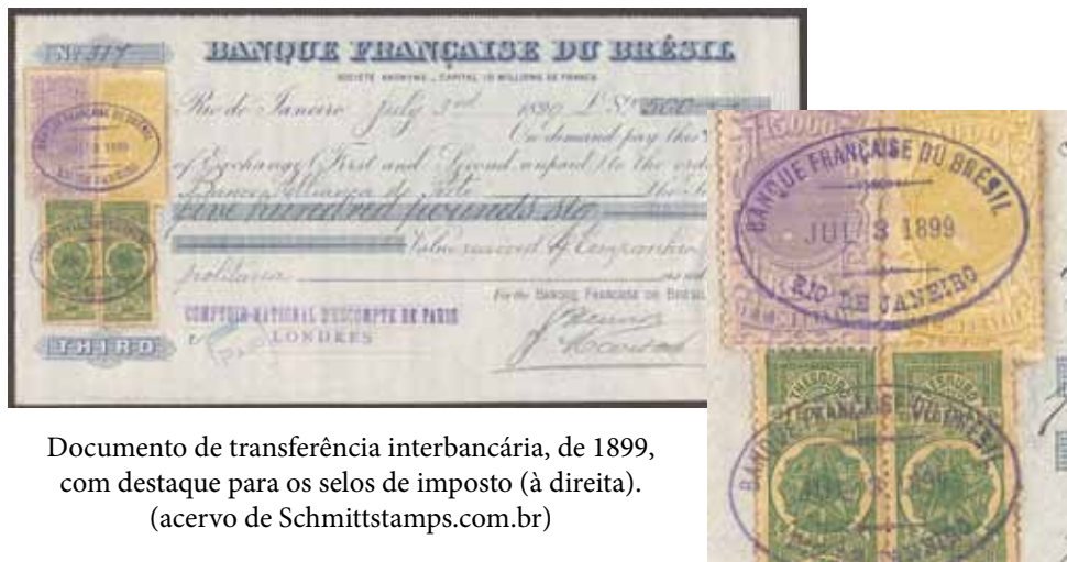
Documento de transferência interbancária, de 1899, com destaque para os selos de imposto (à direita).

Mas a popularização do uso de estampilhas, para que o Poder Público controlasse o pagamento de impostos, foi decisiva para o apelido do presidente: CAMPOS “SELLOS”.