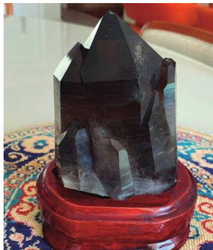
Prêmio Clube Filatélico e Numismático de Santos (PE3)