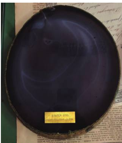
Prêmio Tenor & Pelizzari Leilões (PE4)