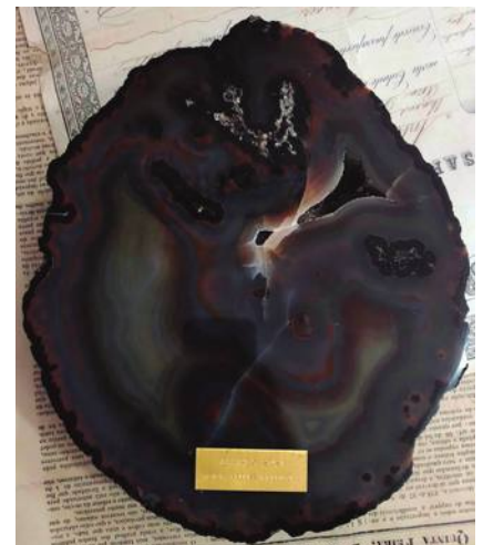
Prêmio Tenor & Pelizzari Leilões (PE5)