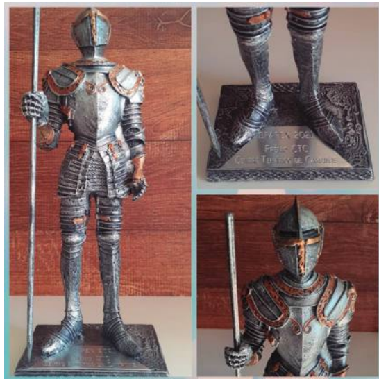
Prêmio Centro Temático de Campinas (PE2)