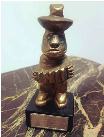
Prêmio Sociedade Filatélica Riograndense (PE1)