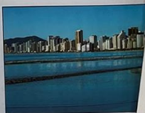
Balneário Camboriú - A Dubai Brasileira

Neste número: Fatos da história da AFSC. Filatelia, Numismática e Cartofilia -